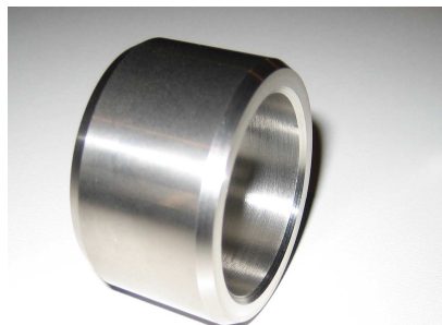
FDI ® - Bekleding Type: MC