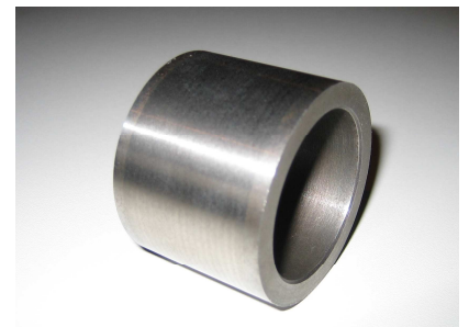
FDI ® - Bekleding Type: HC