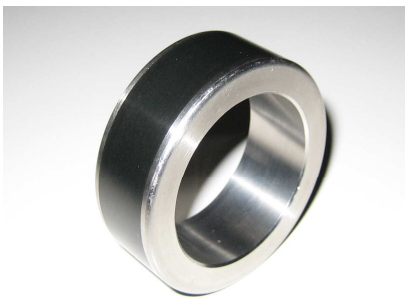
FDI ® - Bekleding Type: OC